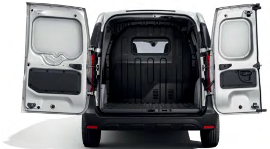
nákladový prostor vozu Express Van