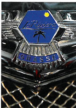
První vůz nese jméno Grasse na chladiči