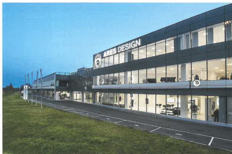
Čistý design rekonstruovaného areálu bývalého dealerství Fiat Group

Firma se výrazně ohrazuje proti popisu své činnosti jako tuningu. Navrhuje karosérie a přestavby existujících automobilů a motocyklů. S homologací nejsou problémy, protože nezasahují do šasi. Každý projekt Ares má svého specifického dárce komponentů, pečlivě vybraného tak, aby co nejvíce vyhovoval záměru. Nezávislá společnost není ve výběru dárců nijak omežována.