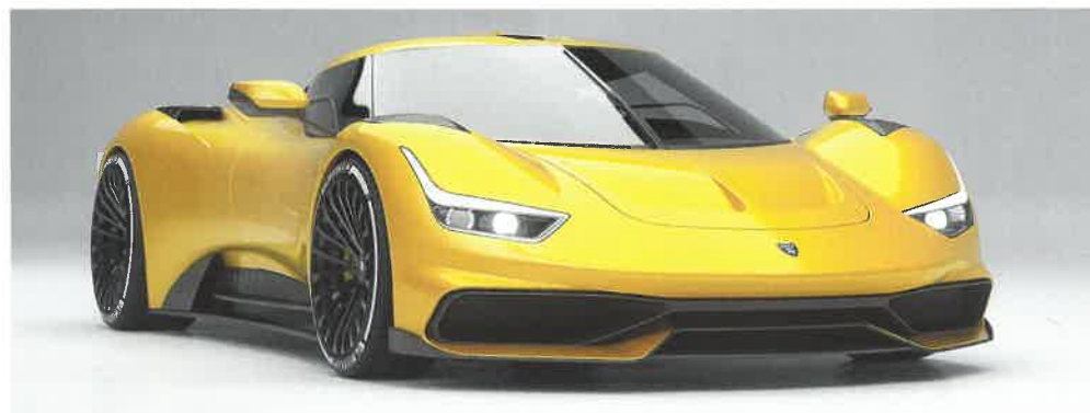
Futuristický Project S1 Coupé

/600 N.m). Doposud se jich zrodilo 7 + 1 (z akce Concorso d'Eleganza Villa d'Este). Konstruktivním oříškem bylo upravit v Lamborghini standardní dvouspojkovou (Doppia Frizione) sedmistupňovou převodovku s ovládáním páčkami na volantu na řazení klasickou řadicí pákou se zdáním (pocit a sluchovými vjemy), jako by řidič měnil převodové stupně klasicky ručně. Pasážery oblaží dokonalý sound systém Marka Levinsona, švýcarského mága věrnosti bytového poslechu.