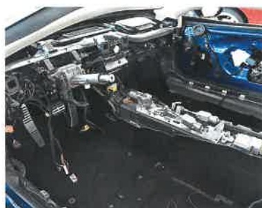
Odstrojený interiér Panther ProgettoUno s mechanismem na středním tunelu, navozujícím dojem ručního řazení

Všechny vozy vznikají na základě objednávek a přání zákazníka. V centrále Ares pracuje asi 160 lidí.