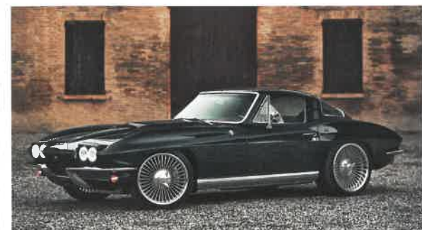
Vzkříšený Chevrolet Corvette C2 Sting Ray (1964)