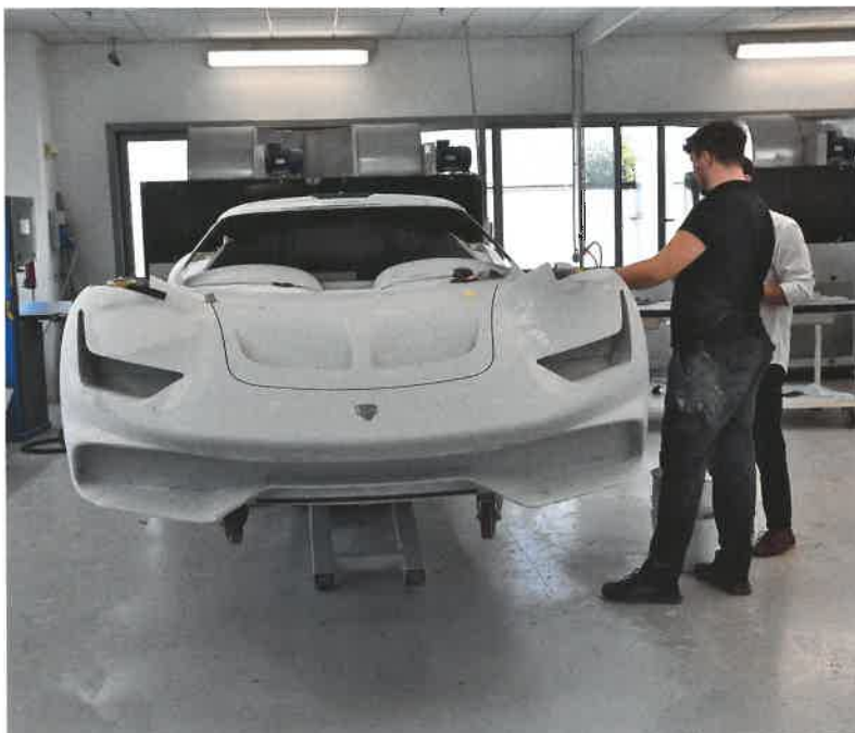
Stavba nové karosérie Projectu S1 Coupé, tentokrát na bázi Corvette C9

Autor děkuje panu Riccardu Pozzatovi za podrobnou prohlídku karosárny a podklady. ■