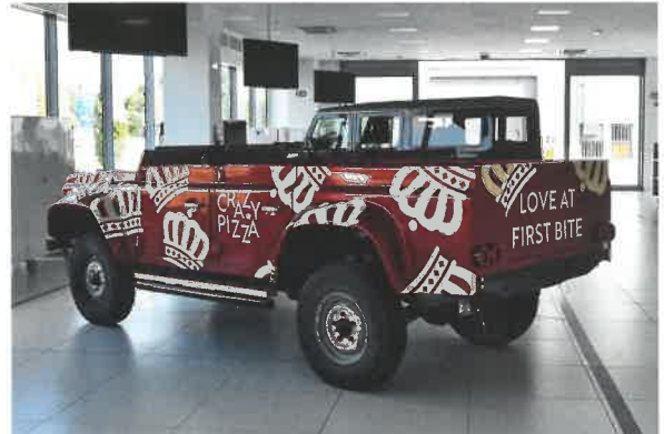
Land Rover Defender je vděčným objektem karosárny. Postavili již nejméně 12 kabrioletů. Tento si objednala jedna restaurace

Za částku začínající na 215 000 eurech je možné pořídit „obránce všech obránců“ – upravený Land Rover Defender, jichž si firma pořídila slušnou zásobu. Tvoří velký podíl objednávek. Ares postavil též povedenou Tesla Cabriolet, má rozkreslené i rychlé kombi Tesla Shooting Brake. A to firemní podklady nehovoří o připraveném, ale patrně nerealizovaném záměru novo-