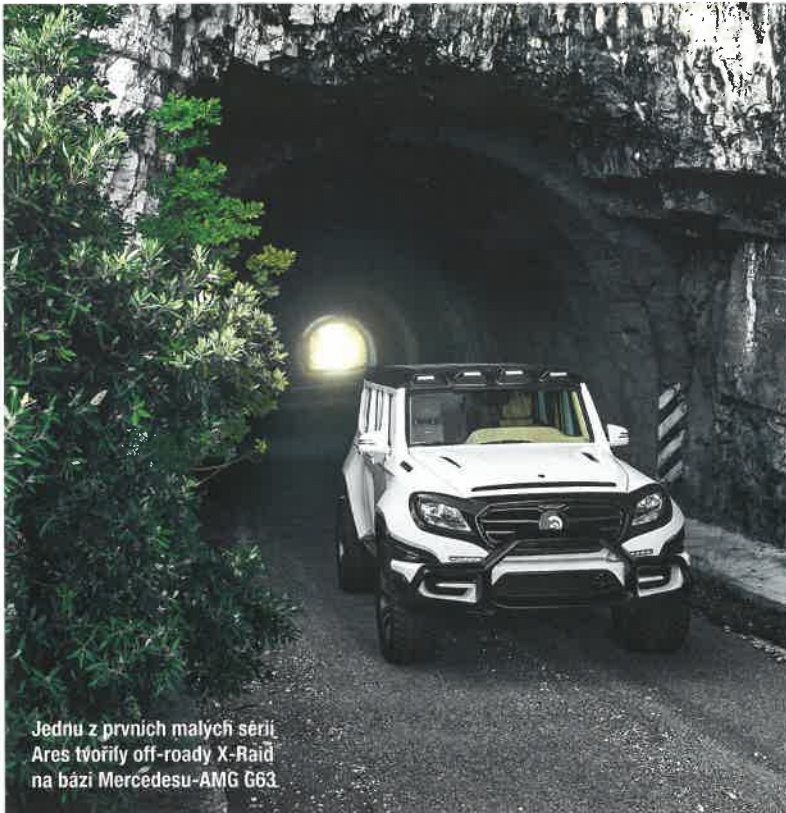
Jednu z prvních malých sérií Ares tvořily off-roady X-Raid na bázi Mercedesu-AMG G63.

sche Turbo S, úpravě vysoce výkonných sportovních katalyzátorů, důkladně přeprogramované řídicí elektronice a vysokotlakému palivovému čerpadlu (160 barů) konstruktéři získali působivých 423 kW (575 k) a 675 N.m. Podvozek přizpůsobili o 30 % vyššímu výkonu instalací výškově nastavitelným podvozkem s pružinami a tlumiči KW a šestičlankovými (vpředu) a čtyřčlankovými (vzadu) brzdami s karbon-keramickými kotouči. Objevila se sada širších 21palcových kol z lehkých slitin. Do interiéru se vrátilo čalounění látkou Porsche Pepito. Podobnou kúru prodělalo později i Porsche 964 Targa, které dostalo techniku z moder-