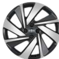
18" kola z lehkých slitin, pneumatiky 175/60 R18 Pro výbavu Executive