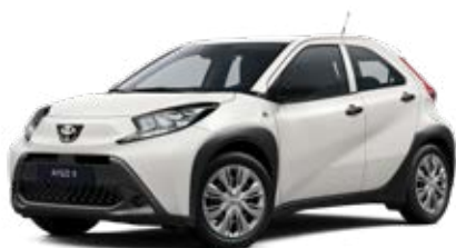
040 Bílá – čistá Základní lak pro verze Active a Comfort bez příplatku