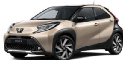
2VJ Běžová – ginger s černou střechou Metalický lak pro verze Style, Executive a Selection 15 000 Kč