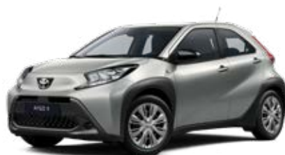
1L0 Stříbrná – třpytivá Metalický lak pro verze Active a Comfort 10 000 Kč