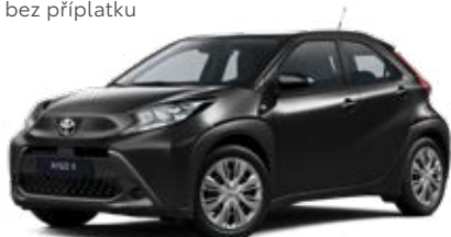
209 Černá – noční obloha Metalický lak pro verze Active a Comfort 10 000 Kč