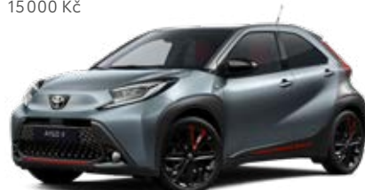
2ZY Modrošedá s černou střechou Metalický lak pro verzi UNDERCOVER 15 000 Kč