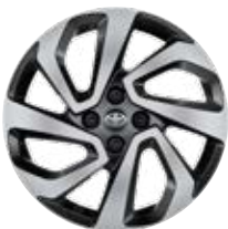
17" kola z lehkých slitin, pneumatiky 175/65 R17 Pro výbavu Style