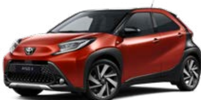
2VH Červená – chilli s černou střechou Metalický lak pro verze Style, Executive a Selection 15 000 Kč