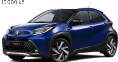
2VL Modrá – juniper s černou střechou Metalický lak pro verze Style, Executive a Selection 15 000 Kč