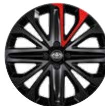
18" kola z lehkých slitin, pneumatiky 175/60 R18 Pro výbavu UNDERCOVER