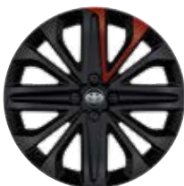
18" kola z lehkých slitin, pneumatiky 175/60 R18 Pro výbavu Selection v barvě karoserie 2VH Červená – chilli s černou střechou a 2VL Modrá – juniper s černou střechou