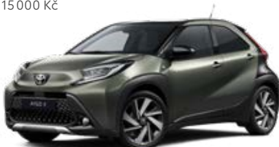
2VK Zelená – cardamon s černou střechou Metalický lak pro verze Style, Executive a Selection 15 000 Kč