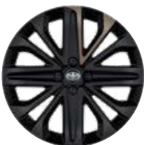
18" kola z lehkých slitin, pneumatiky 175/60 R18 Pro výbavu Selection v barvě karoserie 2VJ Běžová – ginger s černou střechou a 2VK Zelená – cardamon s černou střechou