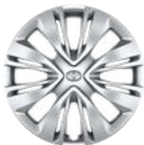
17" ocelová kola s celoplošnými kryty, pneumatiky 175/65 R17 Pro výbavu Active, Comfort