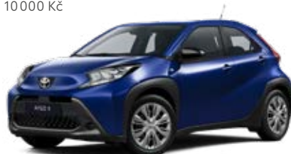
8Y8 Modrá – juniper Metalický lak pro verze Active a Comfort 10 000 Kč