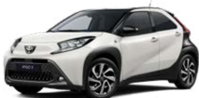
2NR Bílá – čistá s černou střechou Základní a metalický lak pro verzi Style 15 000 Kč